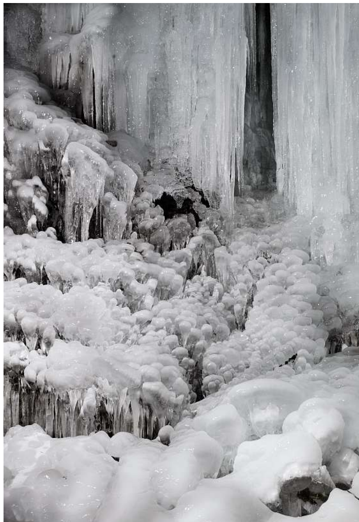
Die Vertikale, das Element des Ueli Steck. | Straight up: Ueli Steck's direction.